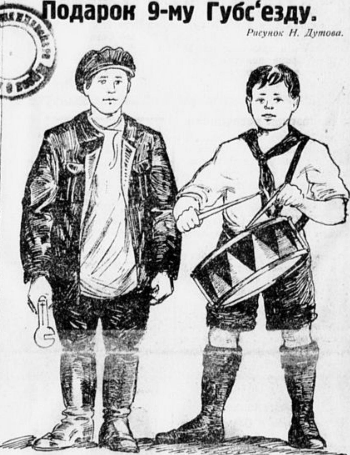
Постановление 8-го Губс'езда РЛКСМ выполнено: „На каждого комсомольца в Моск. губ. один пионер“.