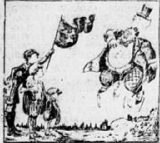
Рост деткомгрупп во всем мире пугает буржуазию.